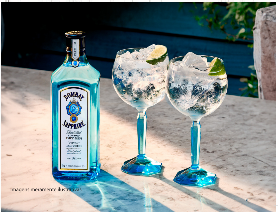
Imagens meramente ilustrativas.